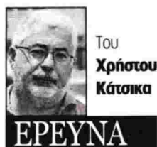
Του Χρήστου Κάτσικα

Από διαφημιστικό γνωστού Κέντρου Ελευθέρων Σπουδών-Κολεγίου